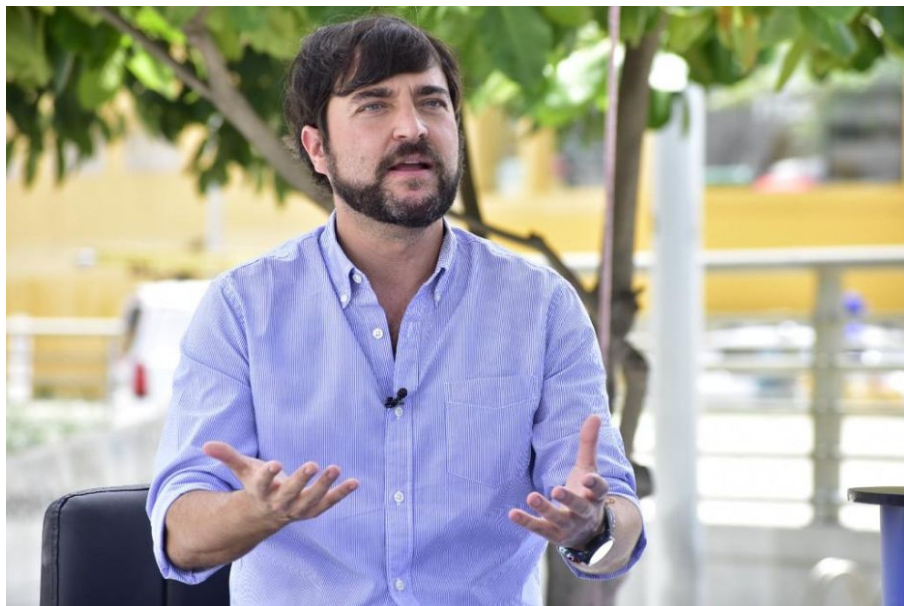
Aquí nuestro Burgomaestre respondiendo a las preguntas de VM Caribe.

Agradecimientos por la ejecución de esta entrevista a: