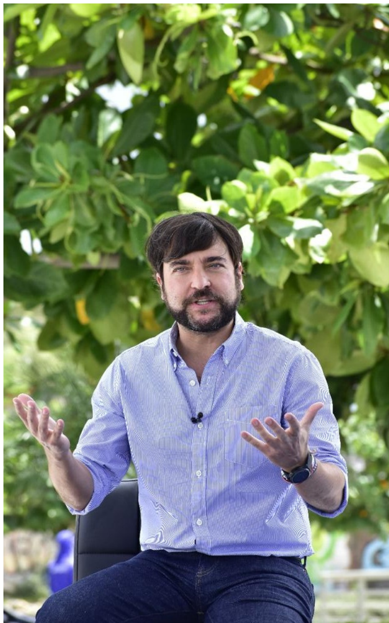
Jaime Pumarejo Heins Alcalde de Barranquilla