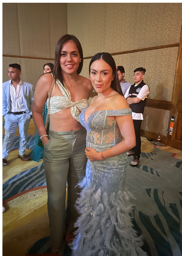
la reconocida influencer Epa Colombia